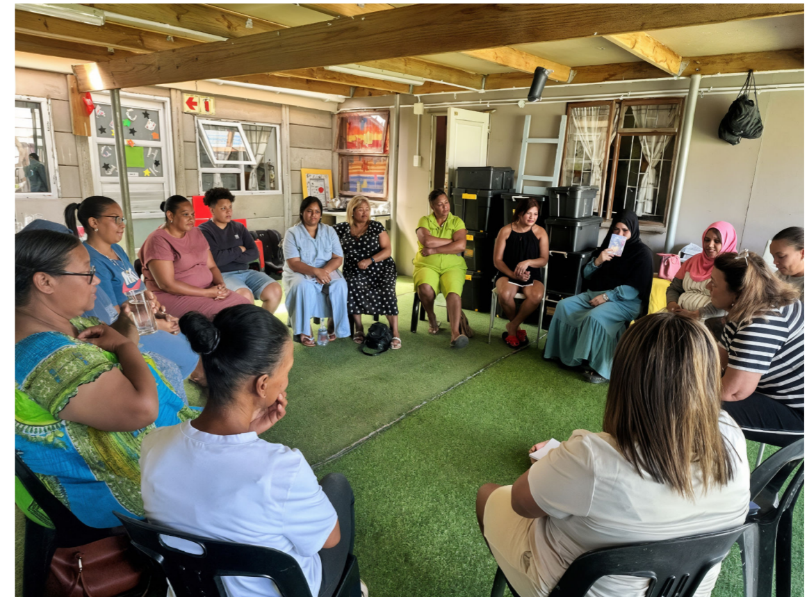
Bijeenkomst met directies en leerkrachten van scholen uit Mitchells Plain in aanwezigheid van de voorzitter van PaL. Citaten in dit jaarverslag zijn afkomstig uit deze bijeenkomst.

Een van de hoofddoelen van PaL is het delen van onze werkwijze. Deze werkwijze is er op gericht dat we ervan overtuigd zijn dat spel voor jonge kinderen de best mogelijke manier van leren is. Spelenderwijs en met plezier doen kinderen kennis van de wereld op, verbeteren ze hun taal en ontwikkelen ze hun vindingrijkheid. Daarin spelen volwassenen een belangrijke rol. Zij creëren de omstandigheden waarin de kinderen kunnen floreren. De train-de-trainer-opzet die PaL samen met Amazing Brainz ontwikkelde begint vruchten af te werpen.